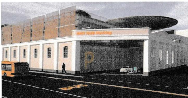
Progetto rinnovamento rimesse Gavette e Staglieno